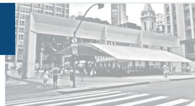
Pórtico da Praça do Patriarca