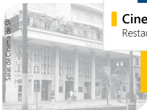
Fachada do Cine Marabá