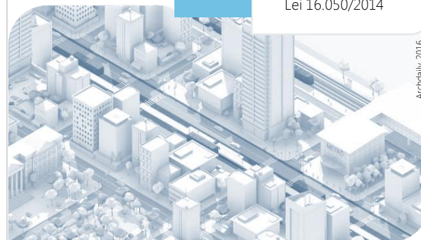
Screenshot de Curta Metragem do Plano Diretor de São Paulo