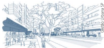
Ilustração Lei de Fachadas