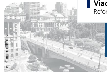
Viaduto do Chá

Requalificação da expansão do centro velho para o centro novo e a criar sinergia com as obras de reurbanização do Vale do Anhangabaú, ampliando a área requalificada do centro